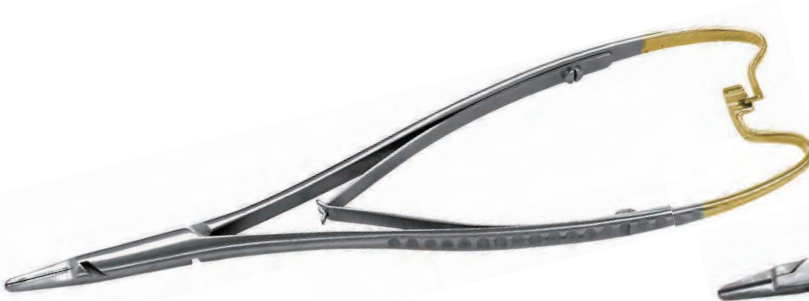
ニードルホルダーマチウ TC加工