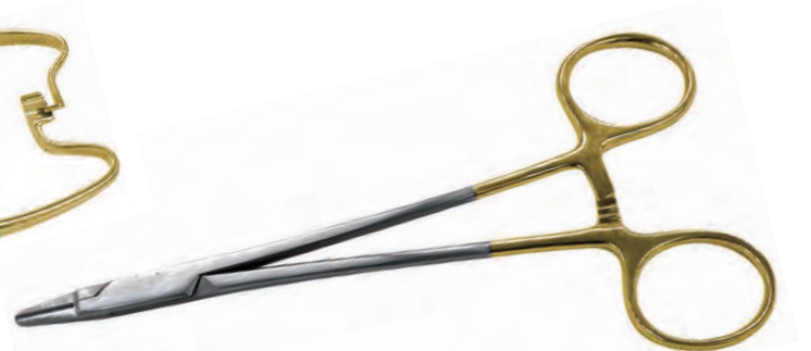
ニードルホルダーマイクロライダー TC加工