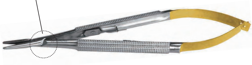
ニードルホルダーカストロビューホ ラウンドTC加工 <縫合糸範囲: 5-0 ~ 6-0>