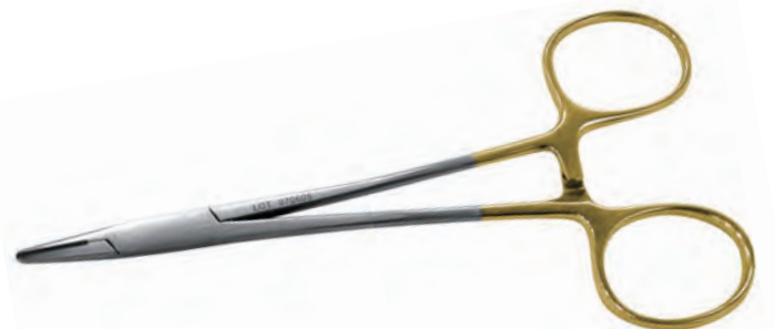
ニードルホルダーメイヨヘーガ TC加工