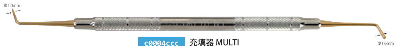
c0004ccc 充填器 MULTI