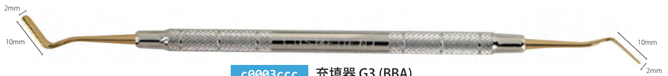
c0003ccc 充填器 G3 (BBA)