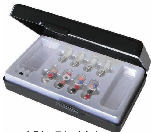
ケラターアタッチメント